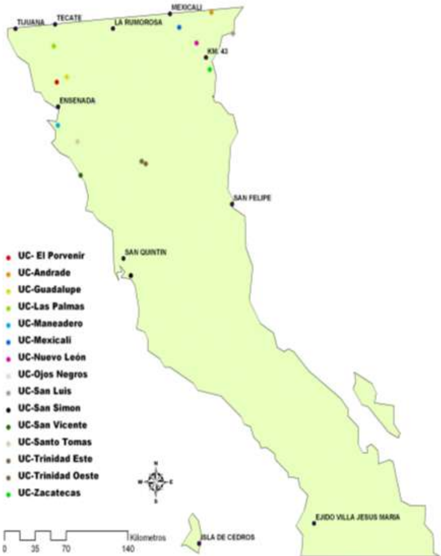
Grafica 1 Distribución geográfica en el estado de las 15 estaciones agrometeorológicas automatizadas del SIMARBC